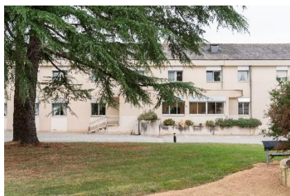
Domaine de la Prévalaye