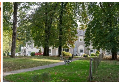
Domaine du lac

Le secteur EHPAD/USLD relève du code de l'action sociale et des familles, notamment des articles L 312-1 et suivants en ce qui concerne les institutions hébergeant des personnes âgées.