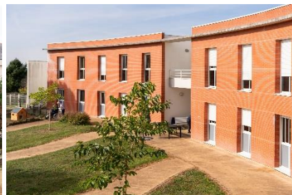
Domaine des 3 chênes