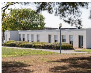
Maison de Retraite de Béré